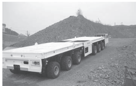
120t 具有防滑控制功能的自走车（不良路况下的倾斜试验，80t：19%）