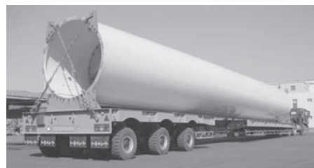
60t 3轴 12轮风力塔运输挂车 （带遥控转向装置，可伸缩）