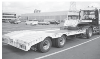
2轴 8轮工程机械运输挂车 （可连接轻量、单后轴牵引车）